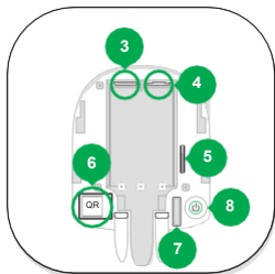
3 - Разъем подключения кабеля питания. 4 - Разъем подключения кабеля Ethernet. 5 - Слот для установки карты сотового оператора (формата Micro-SIM). 6 - QR код. 7 - Кнопка тампера. 8 - Кнопка включения / выключения.