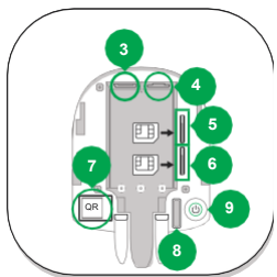
3 - Разъем подключения кабеля питания 4 - Разъем подключения кабеля Ethernet 5 - Слот 2: резервная SIM-карта (формата Micro-SIM) 6 - Слот 1: основная SIM-карта (формата Micro-SIM) 7 - QR код 8 - Кнопка тампера 9 - Кнопка включения / выключения